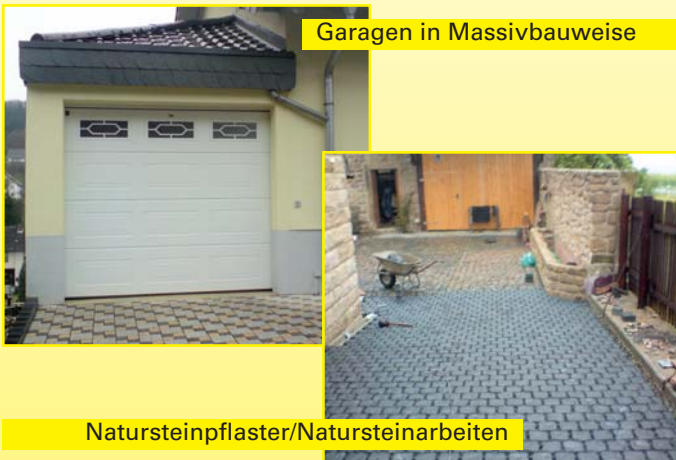
Garagen in Massivbauweise