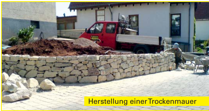
Herstellung einer Trockenmauer