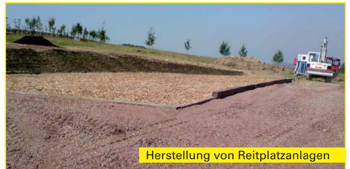
Herstellung von Reitplatzanlagen