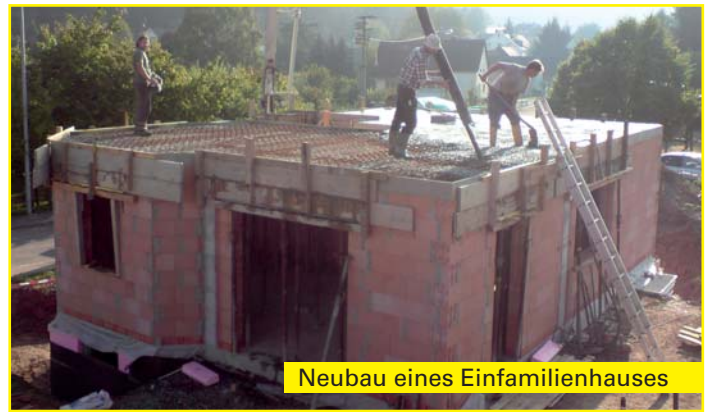
Neubau eines Einfamilienhauses

Um eine qualitativ hochwertige und preisgünstige Arbeit abzuliefern, steht unseren qualifizierten Fachkräften ein breites Angebot an Arbeitsmaschinen und Geräten zur Verfügung. Unsere Arbeit steht für Langlebigkeit und Preiswürdigkeit. Unser Bestreben ist es, gegebene Zusagen einzuhalten und unsere Kunden zufriedenzustellen.