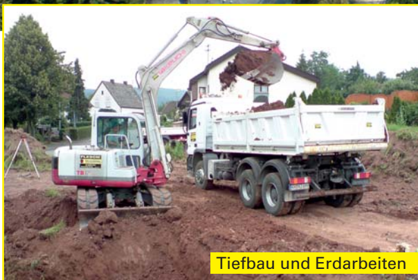
Tiefbau und Erdarbeiten