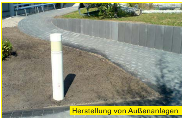
Herstellung von Außenanlagen

Über 85 Jahre Qualität, Service und Zuverlässigkeit